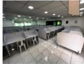
集中しやすい自習室