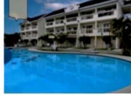
寮のすぐ前に大型プール有り