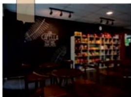
おしゃれなカフェ