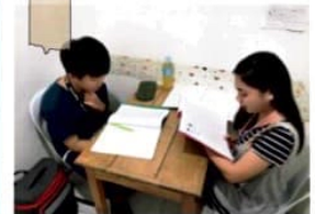
専門講師の丁寧な授業