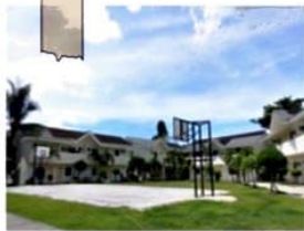
開放感あふれる キャンパス内

開放的な雰囲気運動施設も揃っています。生徒同士の交流がしやすく設計されており、中長期留学の方にもオススメです。