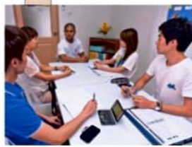
交流もできるグループ授業

ジュニアを含め専門の講師陣(全員正社員)が丁寧に教えてくれますので、初めての留学でも安心です。企業研修実績が高いため、年齢層の高い生徒様を教えることにも慣れています。