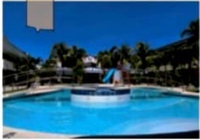
リゾートのようなキャンパス

徒歩3分以内にモールやスーパー、カフェ等周辺環境が充実したリゾートタイプの学校です。