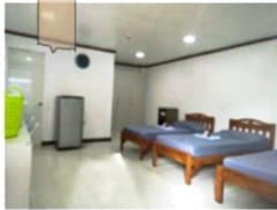
広々と使える3人部屋