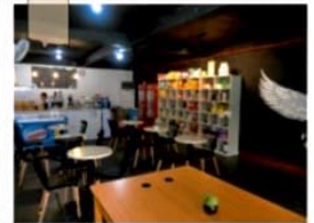
敷地内のおしゃれなカフェ