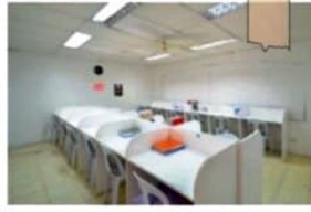
白を基調とした明るい自習室