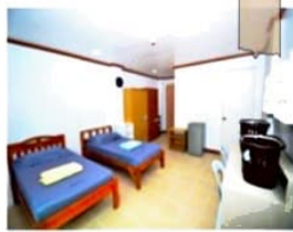
プレミアム個室は2人部屋