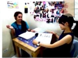
自分のペースで学べる マンツーマン授業